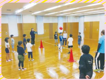
10月21日(土)風船あそび