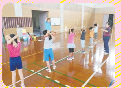
9月23日(土)フリスビー・ティーボール

のびのびスポーツ教室は、月に1~2回程度(土曜日の午前中が中心)、小学生を対象に実施しています。参加には、事前の保険加入が必須ですが、子どもたちのスポーツを楽しむきっかけづくりとして運動遊びを取り入れ、運動の楽しさを実感してもらうような教室となっています。